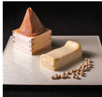
冷凍販売なので、全解凍、半解凍の食感の違いが楽しめるのも魅力。

[価格] 抹茶、黒ごま、西京味噌、きな粉の4種 12cm(200g) 2,000円(税込) 15cm(300g) 2,500円(税込)